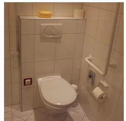
careCLICK alert switch in Griffhöhe direkt neben der Toilette