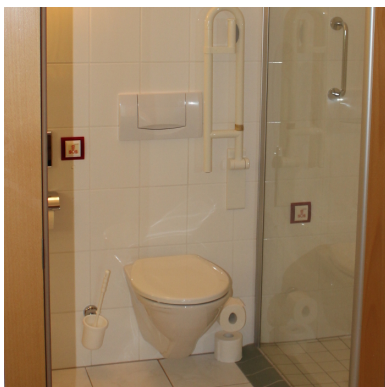
careCLICK alert switch im Toiletten (links) und Duschbereich (rechts)